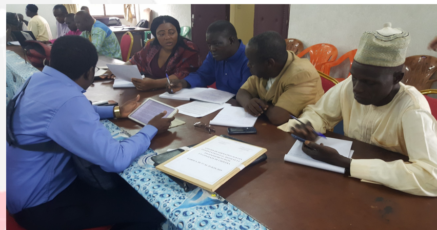
Participants conducting works group during the training in Cameroun

UNICEF, in collaboration with West and Central Africa's cholera platform (WCARO), organized two training sessions in Niger (10-15 June 2019) and Cameroon (17-22 June 2019) on emergency response and elimination of Cholera. Around 50 people attending those training sessions coming from the State technical services (national, regional and local levels) and NGOs. Participants were trained in the organization of cholera preparedness and response, as well as in the development of a national cholera elimination strategy.