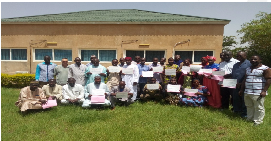
Participants recevant leur diplôme de formation (Niger 10-15 juin 2019)

UNICEF en collaboration avec la plateforme choléra de l'Afrique de l'Ouest et du Centre (WCARO) a organisé deux sessions de formation au Niger (10-15 juin 2019) et au Cameroun (17-22 juin 2019) sur la thématique Réponse d'urgence et élimination du Choléra. Ces sessions de formation ont vu la participation d'une cinquantaine de participants des services techniques de l'Etat (niveau national, régional et local) et des ONGs. Les participants ont été formés à l'organisation de la préparation et la réponse à une urgence choléra, ainsi qu'à la mise en place d'une stratégie nationale d'élimination du choléra.